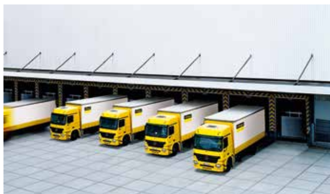
De bedrijfseigen logistiek staat garant voor stipte leveringen.