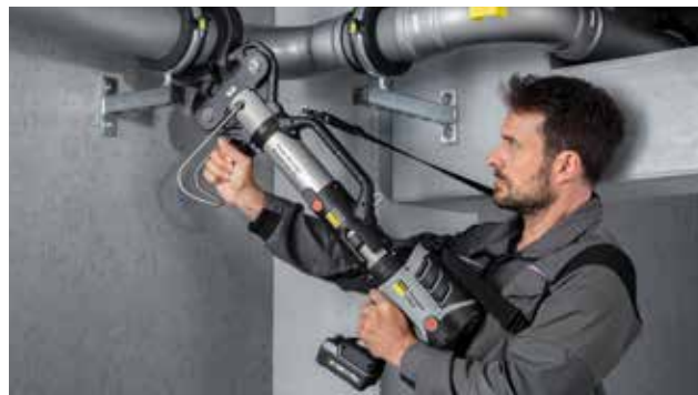
Geschikt voor het persen van dikwandig staal tot en met 4 duim: de Pressgun-Press Booster.